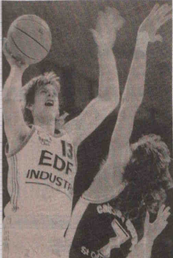
Snyder et Saint-Quentin n'ont pas réussi à se hisser à la hauteur de Butter et de Mulhouse.