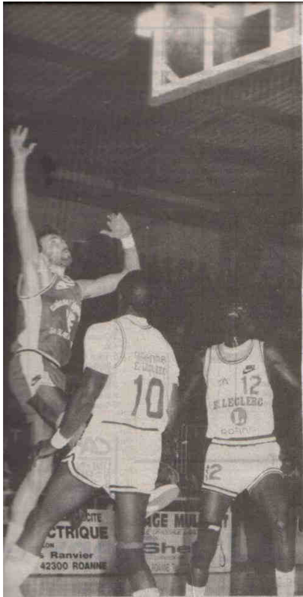
Myder s'est bien battu et son adresse à trois points se saluait pour S.Q.B.B.